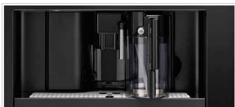
Reserva de agua con capacidad de 1'8 L