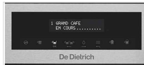
Un menú funcional y fácil de utilizar